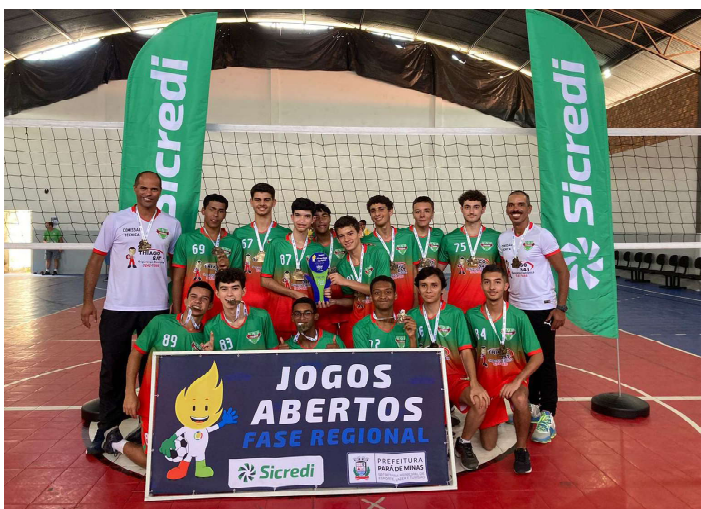
Equipe de vôlei sub-18

A Prefeitura de Itaúna, por meio da Secretaria Municipal de Esportes e Lazer, retornou com a Seleção de Itaúna na Fase Regional nos Jogos Abertos em Pará de Minas.