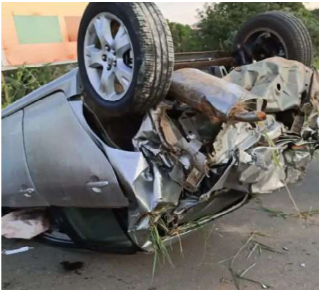
Um Corolla ficou destruído após um acidente na MG-050, na tarde de sábado 07/5.

Segundo o Corpo de Bombeiros, a corporação foi acionada as 17h02, na MG 050 próximo ao bairro Piaguassu, para atender a vítima do capotamento.