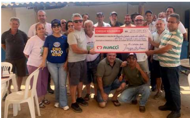
No dia 17 de setembro, foi entregue à Avacci o cheque simbólico de R$ 275 mil arrecadados com doações de gado, cavalos, porcos, galinhas e alimentos. O dinheiro foi enviado via Pix para a conta da Avacci. Além disto, foram entregues muitos utensílios doados por grande parte do comércio. O evento foi organizado pelos Amigos da Avacci. Muito bom!!!