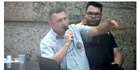
O Secretário de Infraestrutura Rosse Andrade