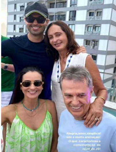
Alegria, amor, simplicidade e muita animação! O que caracterizou a comemoração ao nível do JS!