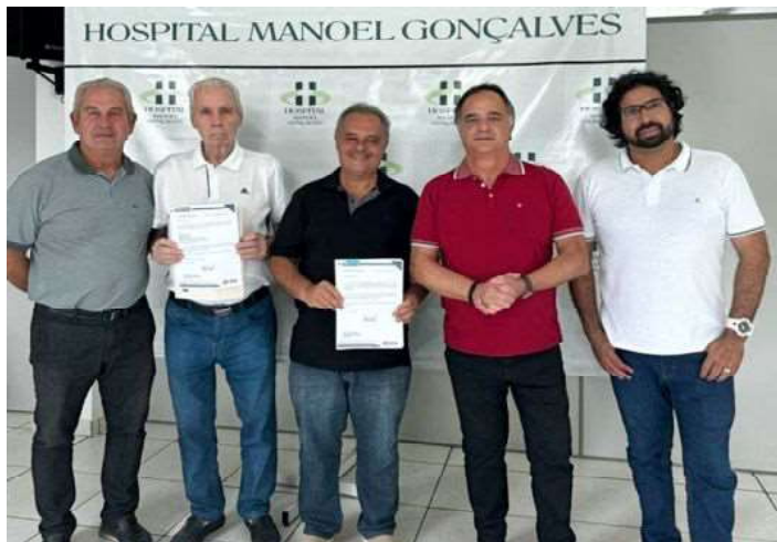
Na foto, os diretores do Hospital Guerra, Mourão e Dr. Bicalho com o ex-deputado Gustavo Mitre e o deputado Mauro Tramonte

O ex-deputado estadual Gustavo Mitre recebeu em Itaúna, no sábado, dia 9 de março, o deputado estadual e comunicador da Rede Record, Mauro Tramonte, atualmente exercendo o segundo mandato na Assembleia Legislativa de