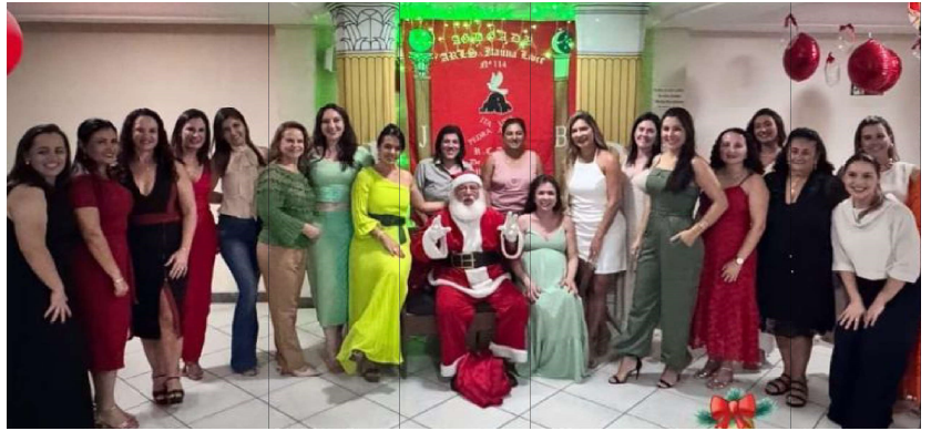
Confraternização de final de ano das esposas dos maçons de Itaúna. Desejamos Boas Festas!