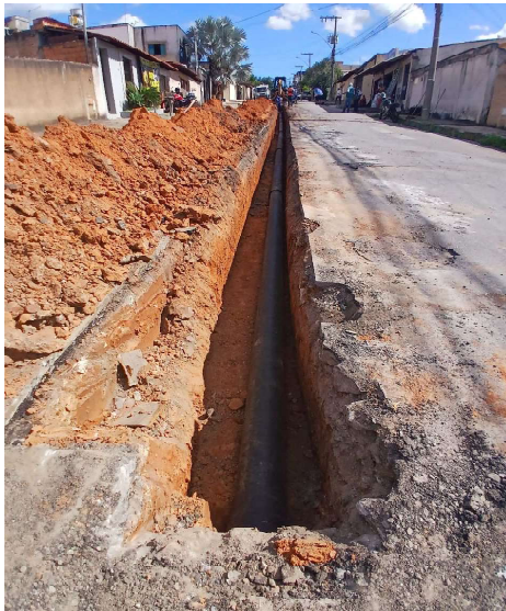
A nova rede no Cidade Nova, já em construção, terá cerca de 50 m de extensão