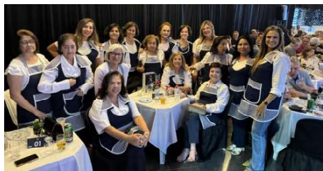
Companheiras da Casa da Amizade deram um showzão de organização, o que resultou em grande sucesso da Noite de Massas, que aconteceu no Automóvel Clube