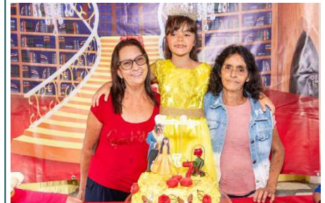
Dedico este cordel à minha mãe, minha sogra e todas as mães amorosas

A força de uma guerreira, Vence seca e provação Com fé verdadeira. Seu sorriso ilumina Como o sol lá de Minas Na manhã de quarta-feira. No fogão de lenha aceso Tem café e acolhimento, Cada gesto traz aceso Um pedaço de sentimento. Seu abraço é proteção, É remédio pro coração Nos dias de sofrimento. Batalhou desde menina, Nunca fugiu da lida, Foi rocha firme e divina Nas estradas dessa vida. Mesmo cansada sorria, E com fé sempre seguia, Sem jamais baixar a vista. Minha mãe é dessas flores Que o tempo não faz murchar, Quanto mais passam as dores Mais aprende a perfumar. Tem no peito honestidade, Na alma simplicidade E um jeito doce de amar. Se hoje escrevo esses versos Com carinho e emoção, É porque em tantos universos Ela é minha direção. Mãe mineira, tão valente, Seu amor é permanente Dentro do meu coração.