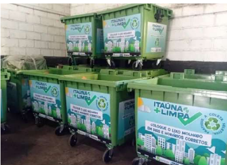
190 contêineres destinados ao recebimento de materiais de forma seletiva serão distribuídos em diversos pontos da cidade e também na zona rural

O relançamento da coleta seletiva, que completa 24 anos de implantação em Itaúna, sendo o ex-Prefeito Osmando um dos idealizadores e fundador do programa em sua primeira gestão, ocorreu na manhã de quarta-feira 01/7, no Teatro Municipal Sílvio de Mattos, numa realização da Prefeitura e do SAAE. Entre os principais avanços desta nova fase está a instalação de 190 contêineres destinados ao recebimento de materiais de forma seletiva (secos e molhados). Os equipamentos serão distribuídos em diversos pontos da cidade e também na zona rural, ampliando o acesso da população ao descarte ambientalmente adequado dos resíduos e fortalecendo as ações de preservação ambiental, educação e conscientização. O relançamento tem como parceiros a COOPERT e a Quantum Engenharia e Consultoria Ambiental. A COOPERT (Cooperativa dos Catadores de Materiais Recicláveis de Itaúna) é responsável pela coleta de lixo seco, triagem e reciclagem dos materiais recicláveis coletados no município, desempenhando papel fundamental na geração de trabalho e renda, na inclusão social dos catadores e na redução dos resíduos destinados ao aterro sanitário. A Quantum Engenharia é a empresa contratada para cuidar da coleta de resíduos molhados, varrição e gerenciamento dos contêineres. Toda a estrutura e investimentos na coleta seletiva se tornam inócuos se não houver a conscientização e a participação direta de cada morador no cuidado com o próprios resíduos.